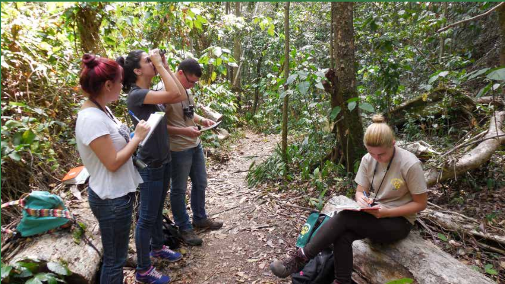
Los estudiantes voluntarios CECIA aplican sus conocimientos y destrezas en los proyectos de investigación ecológica y ambiental, que se llevan a cabo en áreas naturales tales como el bosque Santa Ana en Bayamón.